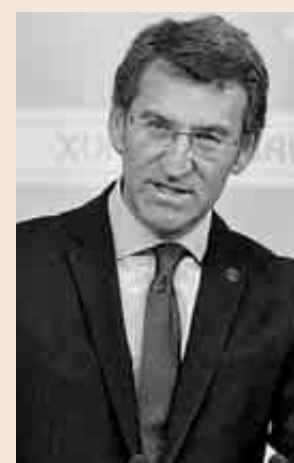
Alberto Núñez Feijóo, ayer tras el Consello de la Xunta.

Por otra parte, el Consello de la Xunta acordó revisar ayer los objetivos turísticos de la comunidad tras los buenos datos de 2014. Así, espera superar en 2016 los 5 millones de viajeros en la comunidad,